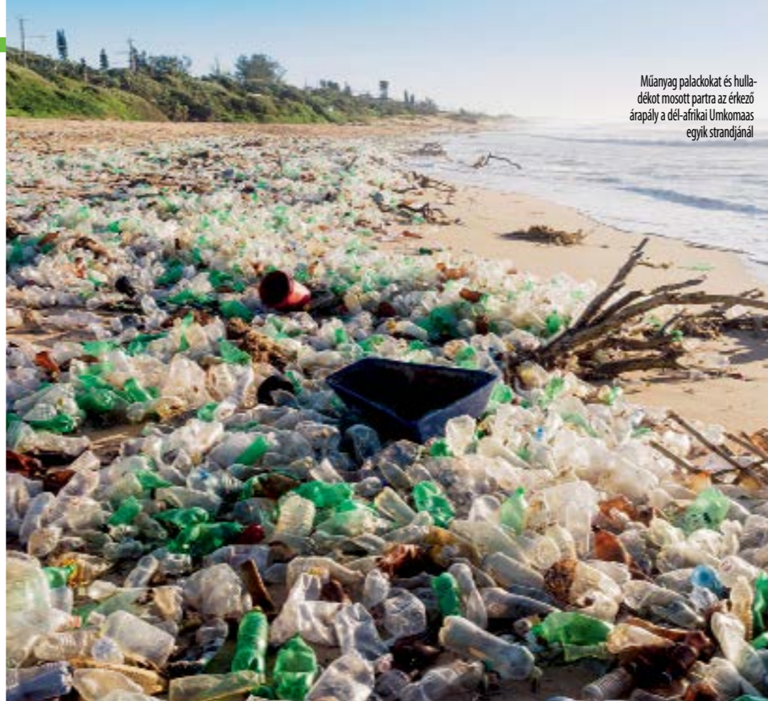
Műanyag palackokat és hulladékokat mosott partra az érkező árapály a dél-afrikai Umkomaas egyik strandjánál

Tudatosá válni. A tudatos vásárló nem a klasszikus fogyasztóvédelmi karaktert tükrözi, azaz nem az, aki nem hagyja, hogy átverjék, aki tisztában van fogyasztói jogaival és él is velük,