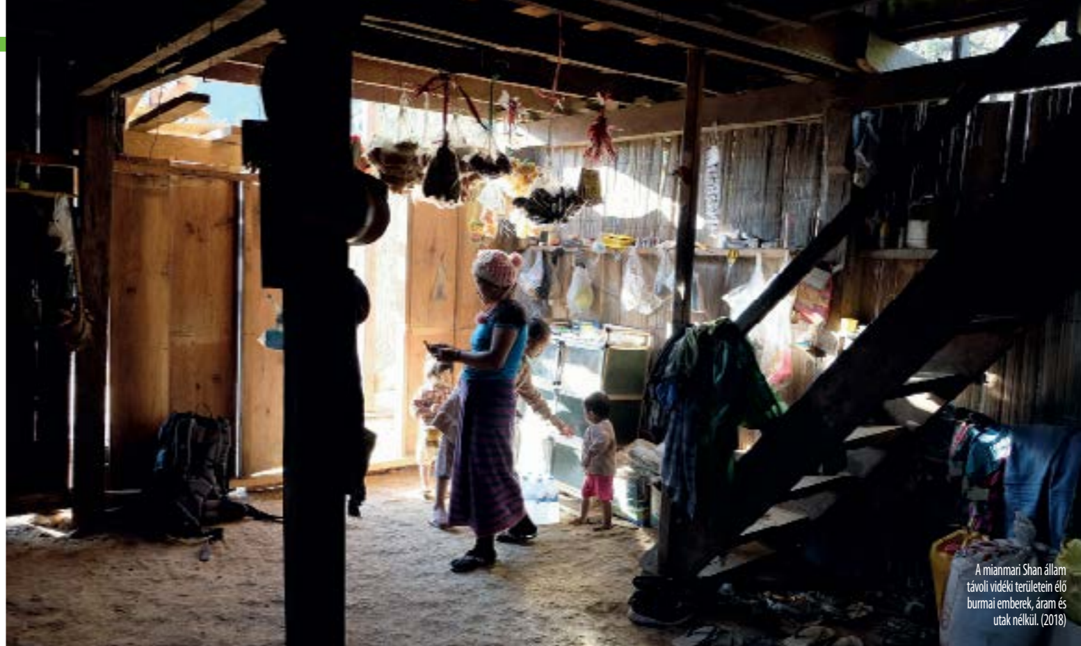
A mianmari Shan állam távolibb vidéki területein élő burmai emberek, áram és utak nélkül. (2018)

A cél ösztönözni a tartós, befogadó, fenntartható gazdasági gyarapodást, a teljes és eredményes foglalkoztatást és a tisztességes munkát mindenki számára. A gazdasági növekedés már a járvány előtt is lassult (2010–2018 2 százalékos GDP/fő; 2019 1,5 százalékos GDP/fő növekedés), a Covid-19 viszont a legnagyobb gazdasági visszaesést hozta a nagy gazdasági világválság óta (1929–1939). A járvány alatt 1,6 milliárd nem hivatalosan foglalkoztatott embernek került kockára a megélhetése. A turizmusnak soha nem tapasztalt kihívásokkal kell szem-