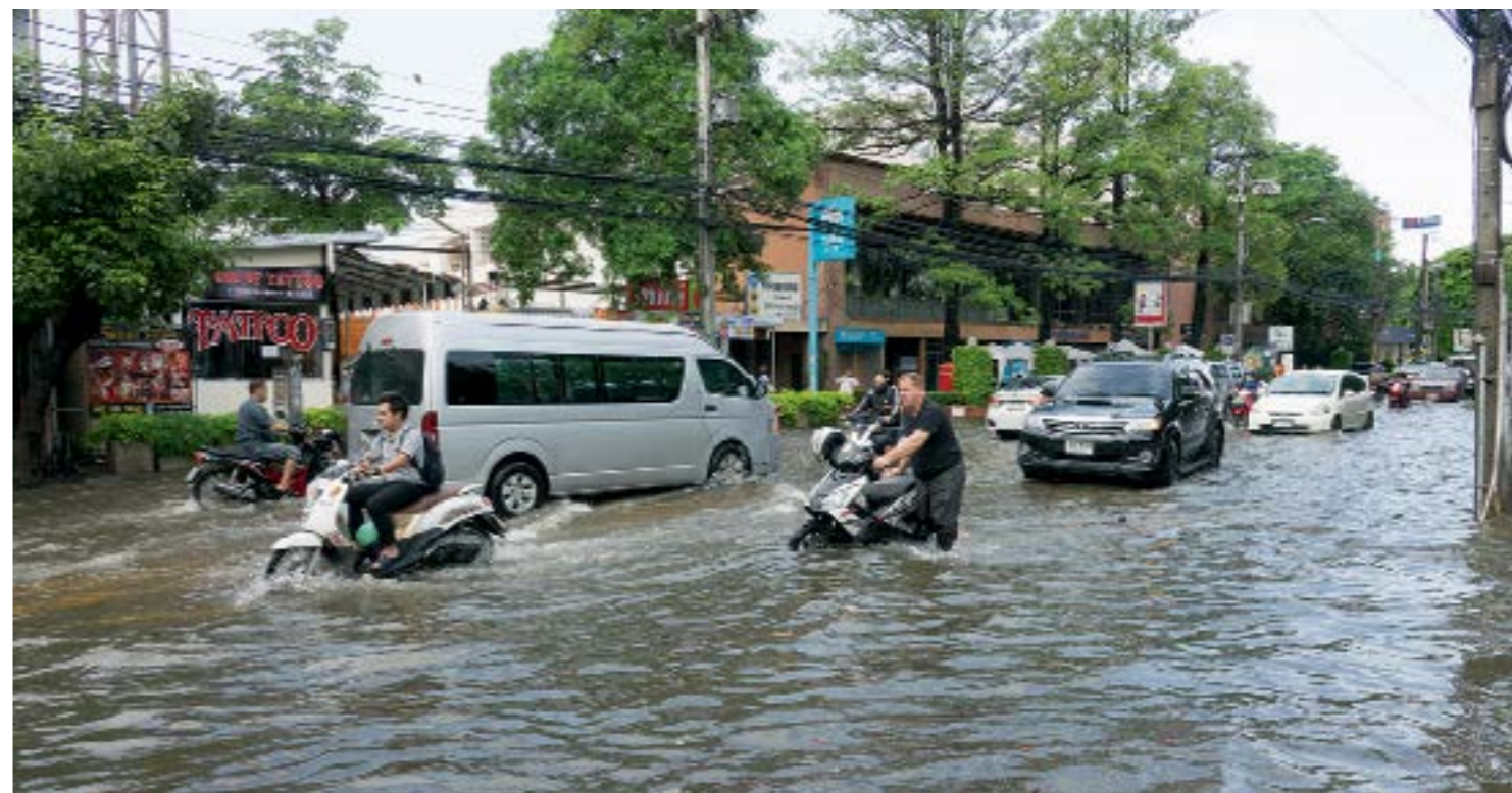
Áradás Csiangmaj városában 2017 májusában