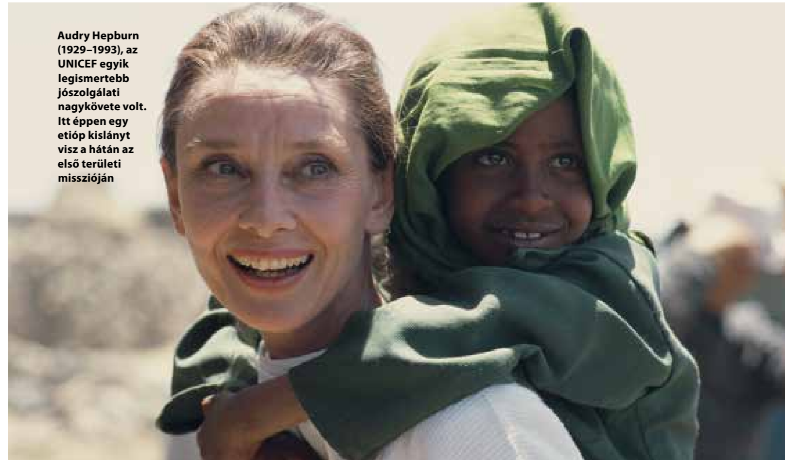
Audrey Hepburn (1929–1993), az UNICEF egyik legismertebb jószolgálati nagykövete volt. Itt éppen egy etióp kislányt visz a hátán az első területi misszióján

Több mint 100 országban vannak jelen, és tényfeltáró nyomozásaik eredményeit sok millió emberrel osztják meg a különböző közösségi média-felületeken. Ennél azonban tovább is mennek: konzultációkat, tárgyalásokat kezdeményeznek kormányokkal, az ENSZ-szel, fegyveres csoportokkal és vállalatokkal annak érdekében, hogy az emberi jogokat védő jogszabályi háttérrel kikényszerítsék. Folyamatosan vizsgálatokat folytatnak a legsúlyosabb kríziseknél: az orosz–ukrán háborúban, a rohingyák menekültválságánál, a tálibok uralta Afganisztánban és az európai menekültválság esetében is.