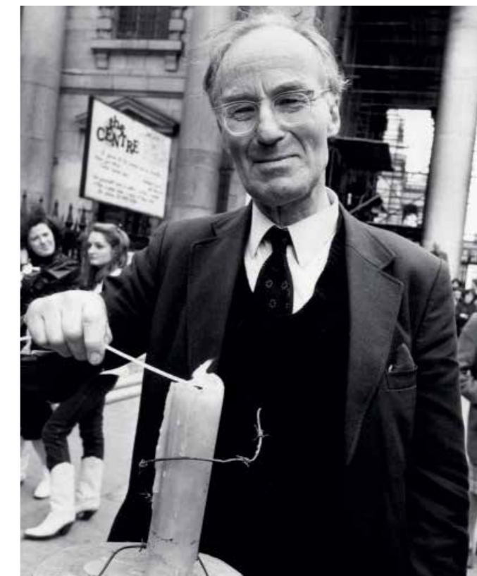
Peter Benenson brit ügyvéd, akinek kezdeményezésével indult az Amnesty International

A jogvédő mozgalom 1961-ben, Peter Benenson brit ügyvéd kezdeményezésével indult, aki egy újságcikkből értesült arról, hogy az akkori portugál autoriter rezsim politikai és vallási meggyőződése alapján börtönbüntetésre ítelt két diákot. Az eset annyira felháborította, hogy egy neves brit lapban ő maga is írt egy cikket, amelyben az emberi jogokat semmibe vevő és elnyomó rendszerek áldozatait melletti kiállásra szólította