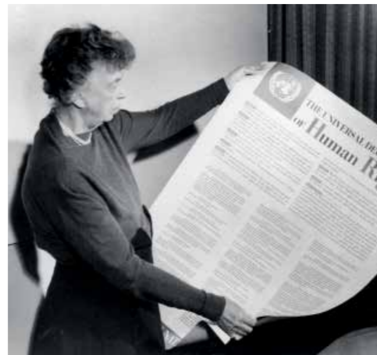
Eleanor Roosevelt és az Emberi Jogok Egyetemes Nyilatkozata

Fontos tisztában lenni vele, hogy univerzális hatálya ellenére a nyilatkozat nem szerződés, így nem tulajdonítható neki semmilyen jogszabályi kötelezettség az országokra nézve. Azonban, mivel a nemzetközi közösség alapvető értékrendjét foglalja magában, az elmúlt hetven év során számos nemzetközi és nemzeti emberi jogi törvény kidolgozása során használták referenciapontként. Ezek közül a legjelentősebb az ENSZ Közgyűlése által 1966-ban elfogadott Polgári és politikai jogok nemzetközi egyez-