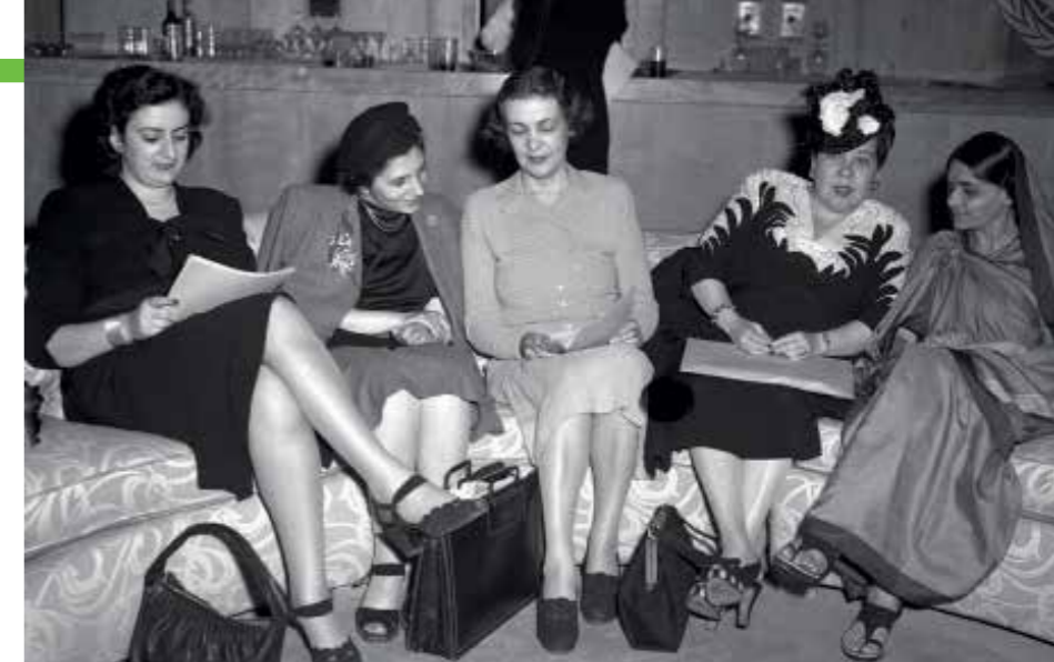
A nők helyzetével foglalkozó albizottság: libanoni, lengyel, dán, domínikai és indiai hölgyek egyeztetnek a kézirat kapcsán. Hansa Mehta (jobb szélén) indiai származású, női jogokért küzdő aktivista volt. Neki tulajdonítják a nyilatkozat szövegezésének egy fontos változtatását. A „Minden férfi szabadnak és egyenlőnek születik” frázist a következőre módosította: „Minden emberi lény szabadnak és egyenlőnek születik”

Végül, de nem utolsósorban az SDG 17 a közös célokért való partnerségek erősítését tűzi zászlajára, amely elsősorban a tudományos fejlődés biztosította előnyökhöz való hozzáférés, a fejlesztésekhez és a nemzetközi együttműködéshez való jog révén kapcsolódik az emberi jogokhoz.